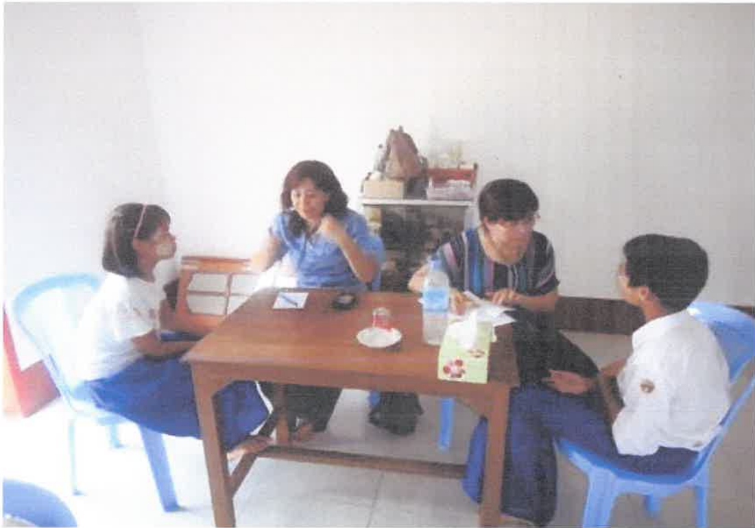
ဒေါက်တာမြင့်မြင့်သင်းမှ -ကွင်းဆင်းဆေးကုသမှု(သုံးခွမြို့)