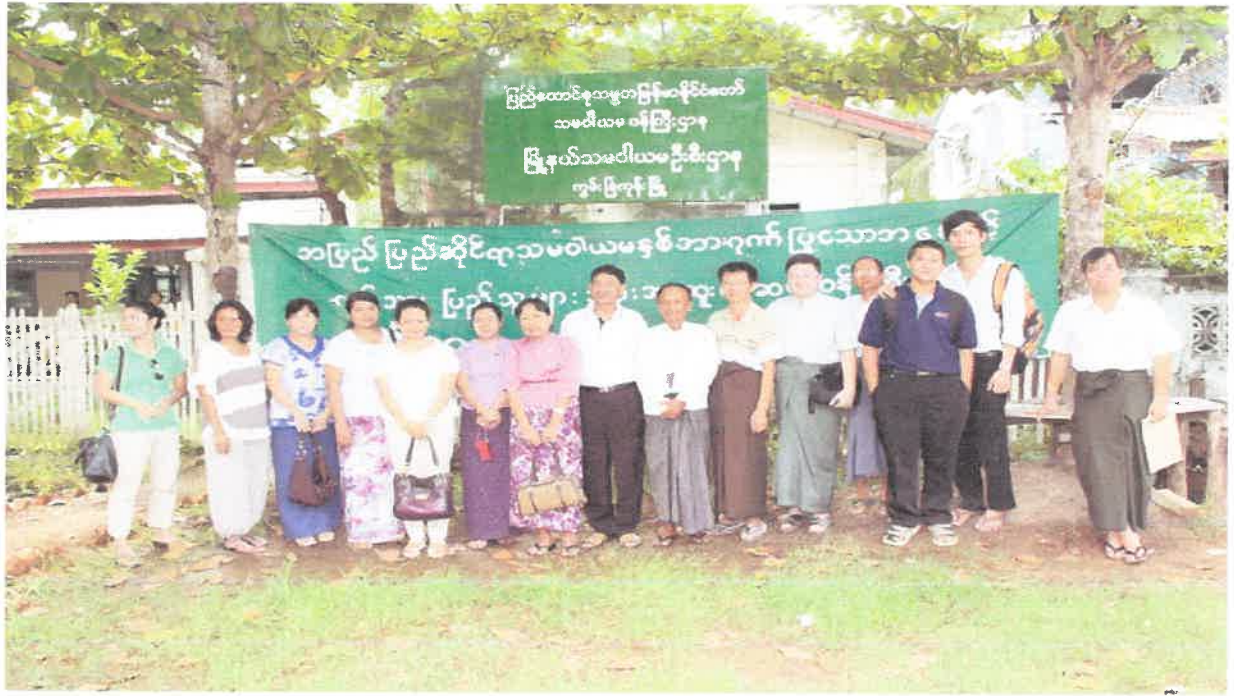
လှည်းကူးမြို့နယ်၊ ရွှေဘိုစုကျေးရွာသို့ ကွင်းဆင်းဆေးကုသမှု မှတ်တမ်း