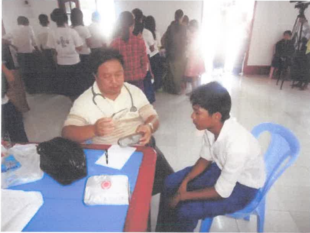
တွံတေးမြို့နယ်၊ မင်္ဂလာမိဘမဲ့ကျောင်းသို့ ဆွမ်းကျွေး မှု မှတ်တမ်း