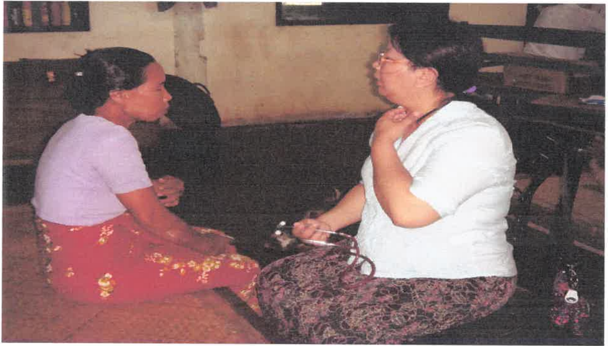
မအူပင်မြို့နယ်၊ လယ်ကိုင်းကျောင်းတိုက် သို့ ကွင်းဆင်းဆေးကုသမှု မှတ်တမ်း