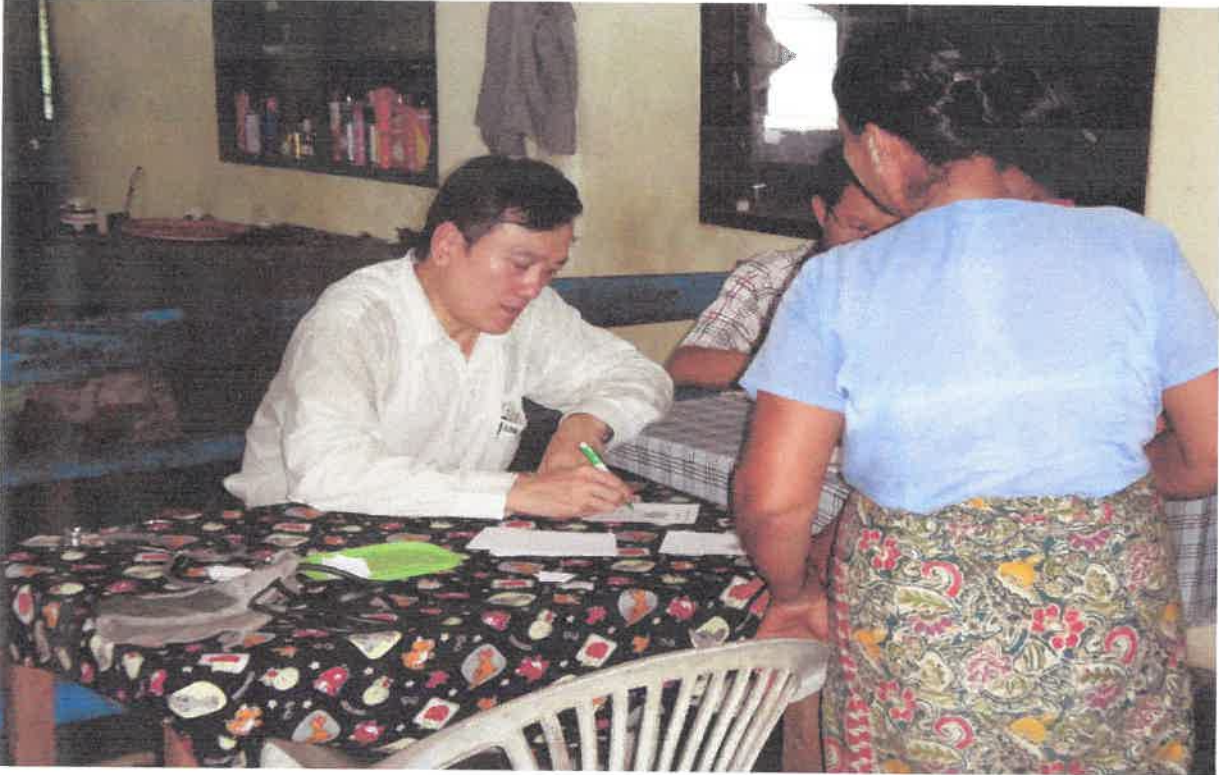
ဒေါက်တာမြမြထွေးကွင်းဆင်းဆေးကုသမှု(လယ်ကိုင်းကျေးရွာ)