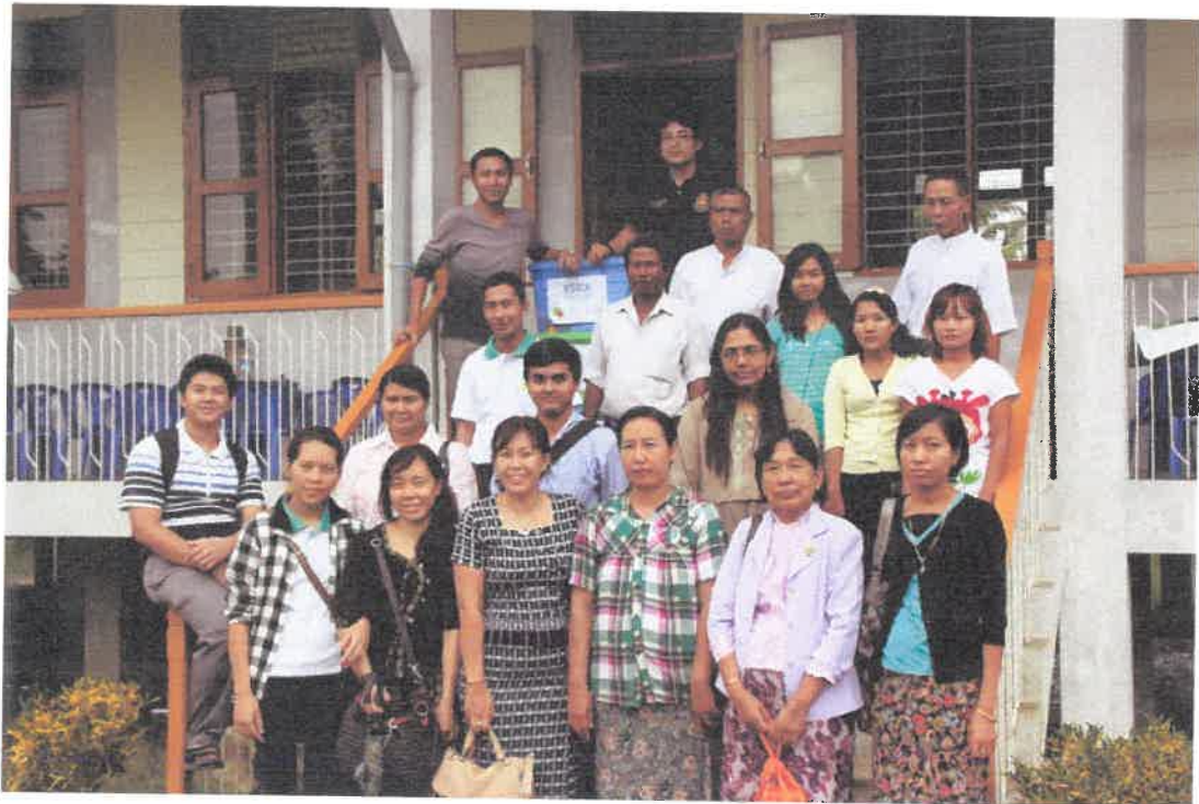
စေတနာဆရာဝန်တစ်ဦးမှ -ကွင်းဆင်းဆေးကုသမှု(ဒေးဒရဲမြို့)