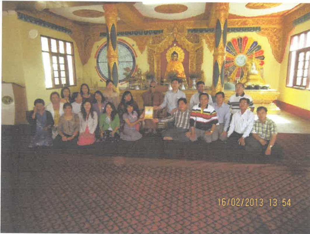
ပြင်ဦးလွင်မြို့၊ ဆရာတော်ဦးညေယျ မျက်မမြင်ကျောင်းသို့ ကွင်းဆင်းဆေးကုသမှုမှတ်တမ်း (၁၆.၂.၂၀၁၃)