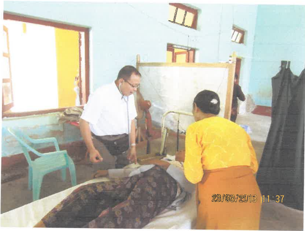
ဝါန်းဇွန်မြို့နယ်၊ ဝါန်းမြာကြီးကျေးရွာ ကွင်းဆင်းဆေးကုသမှုမှတ်တမ်း (၂၃.၃.၂၀၁၃)