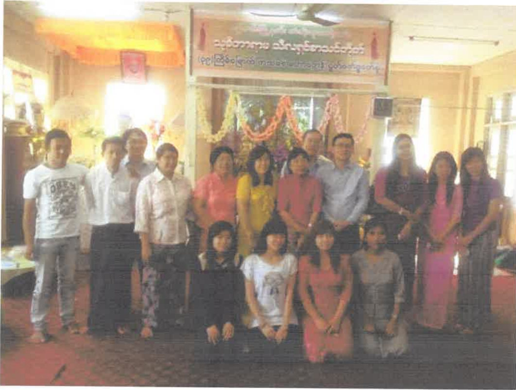
ရန်ကုန်မြို့၊ ရန်ကင်းမြို့၊ နယ်၊ ပဏ္ဍိတာရာမသီလရှင်စာသင်တိုက် ကွင်းဆင်းဆေးကုသမှုမှတ်တမ်း (၂၇.၁.၂၀၁၃)