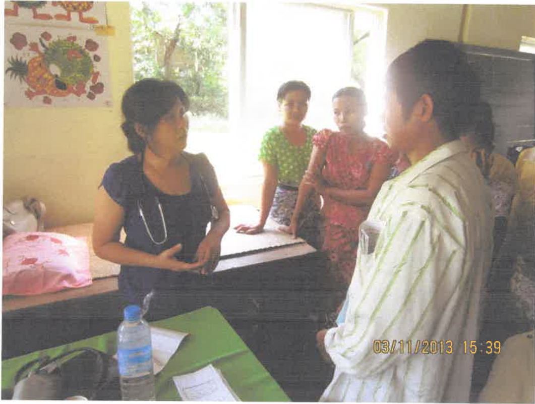
ရန်ကုန်မြို့၊ဟင်္သာတမြို့နယ်၊ဒွတ္တိကျေးရွာ ကွင်းဆင်းဆေးကုသမှုမှတ်တမ်း (၃.၁၁.၂၀၁၃)