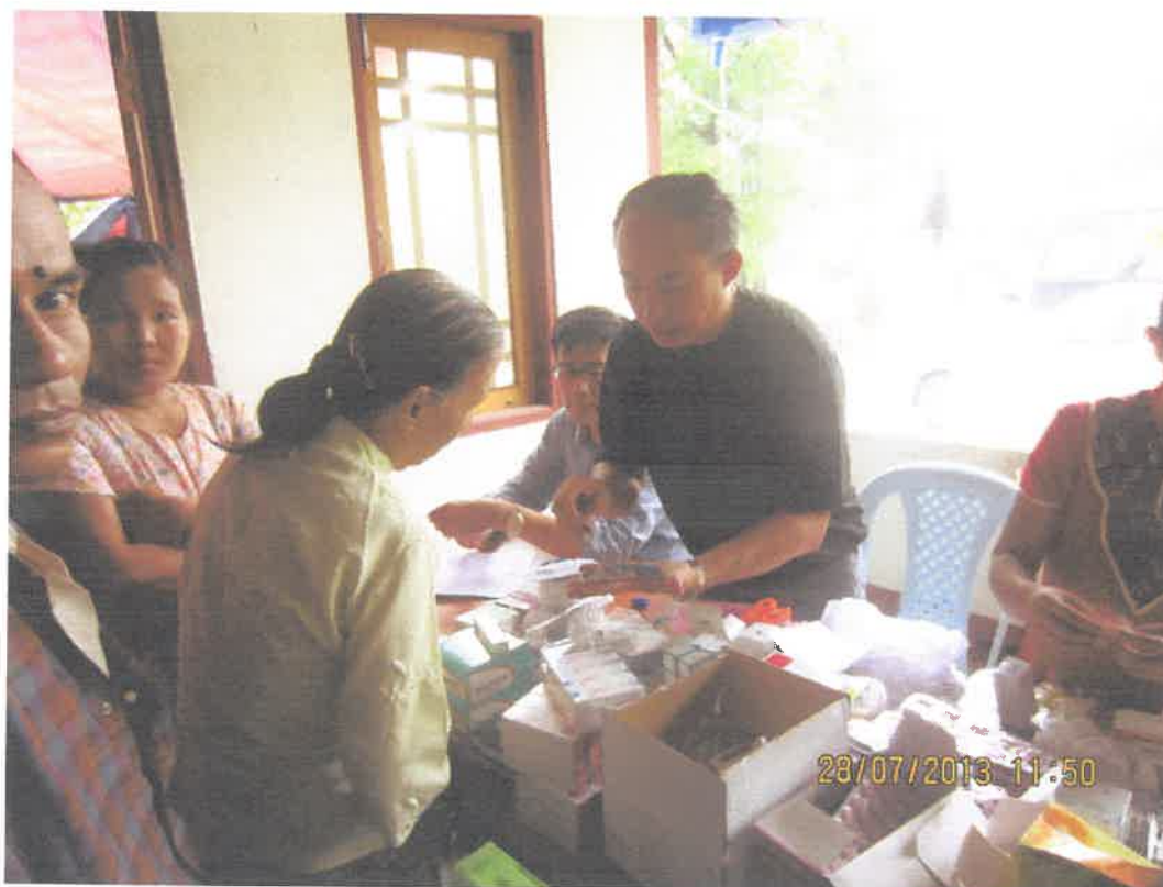
ရန်ကုန်မြို့၊ မင်္ဂလာဒုံမြို့နယ်၊ သယ်န်းကျွန်းကြီးကျေးရွာ ကွင်းဆင်းဆေးကုသမှုမှတ်တမ်း (၂၈.၇.၂၀၁၃)