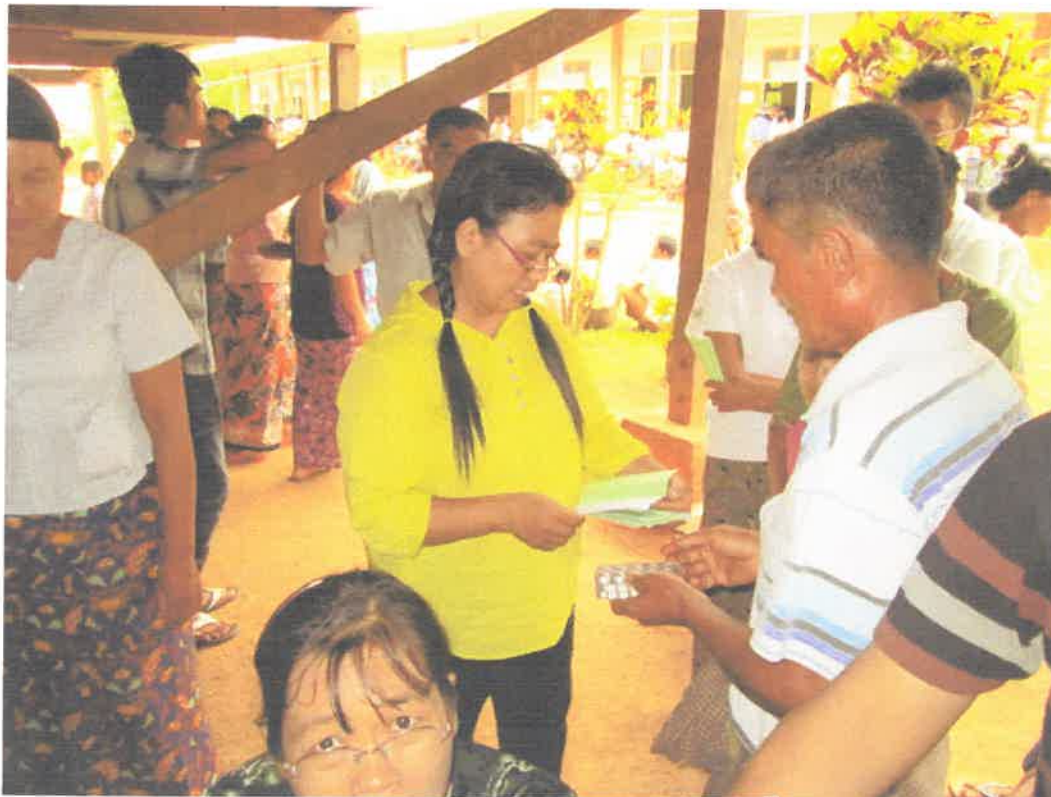
တောင်ကြီးမြို့၊ အင်းလေးဒေသ၊ နွားမေတောင်ကျေးရွာ ကွင်းဆင်းဆေးကုသမှုမှတ်တမ်း (၈.၆.၂၀၁၃)