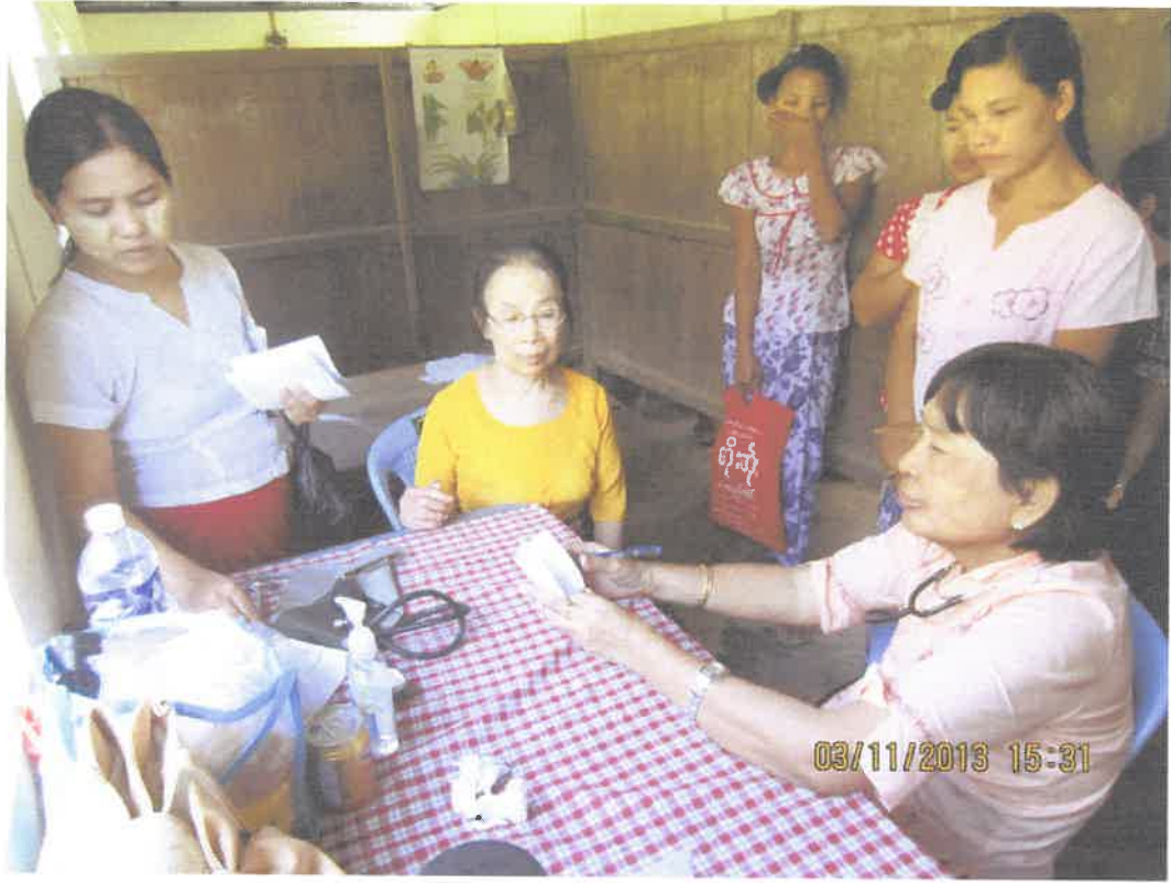
ရန်ကုန်မြို့၊ ဟင်္သာတမြို့နယ်၊ ဒွေစိကျေးရွာ ကွင်းဆင်းဆေးကုသမှုမှတ်တမ်း (၃.၁၁.၂၀၁၃)