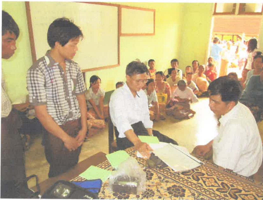
တောင်ကြီးမြို့၊အင်းလေးဒေသ၊နွားမေတောင်ကျေးရွာ ကွင်းဆင်းဆေးကုသမှုမှတ်တမ်း (၈.၆.၂၀၁၃)