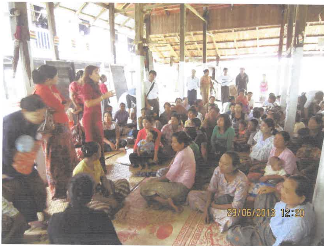
ရန်ကုန်မြို့၊ သန်လျင်မြို့နယ်၊ သနပွင်ကျေးရွာ ကျန်းမာရေးဟောပြောစဉ် (၂၉.၆.၂၀၁၃)