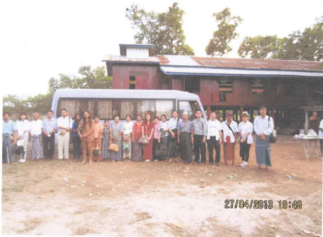
မွန်ပြည်နယ်၊ ကျိုက်မရောမြို့နယ်၊ ကော့သနောကျေးရွာ ကွင်းဆင်းဆေးကုသမှုမှတ်တမ်း (၂၇.၄.၂၀၁၃)