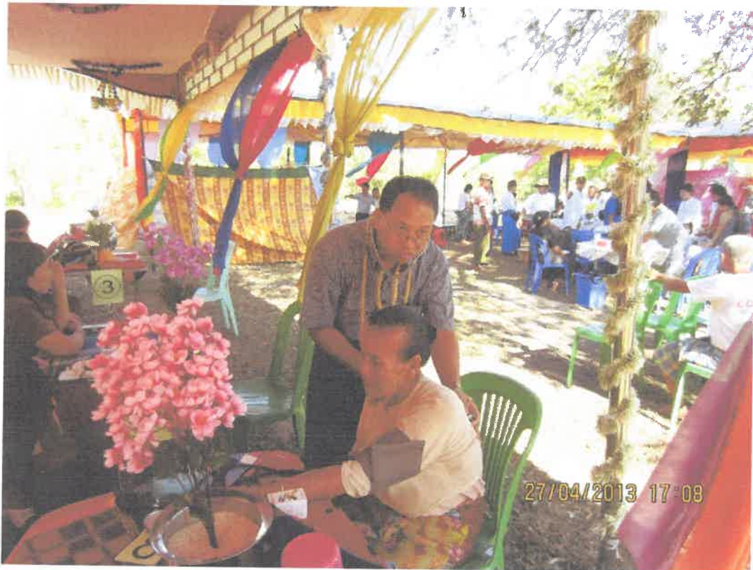
မွန်ပြည်နယ်ကျိုက်မရောမြို့နယ်ကောသနောကျေးရွာ ကွင်းဆင်းဆေးကုသမှုမှတ်တမ်း (၂၇.၄.၂၀၁၃)