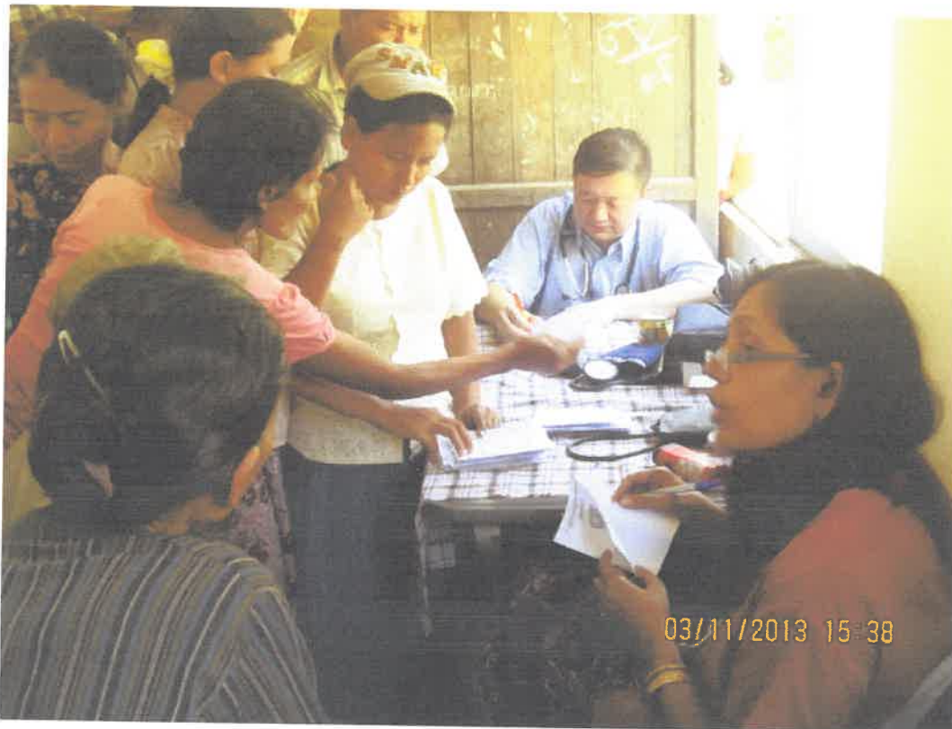
ရန်ကုန်မြို့၊ ဟင်္သာတမြို့နယ်၊ ဒွေမိကျေးရွာ ကွင်းဆင်းဆေးကုသမှုမှတ်တမ်း (၃.၁၁.၂၀၁၃)