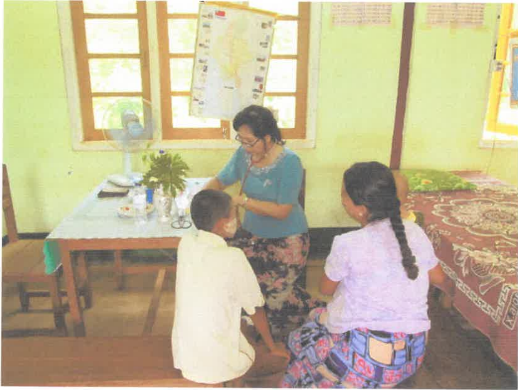
တောင်ကြီးမြို့၊အင်းလေးဒေသ၊နွားမေတောင်ကျေးရွာ ကွင်းဆင်းဆေးကုသမှုမှတ်တမ်း (၈.၆.၂၀၁၃)