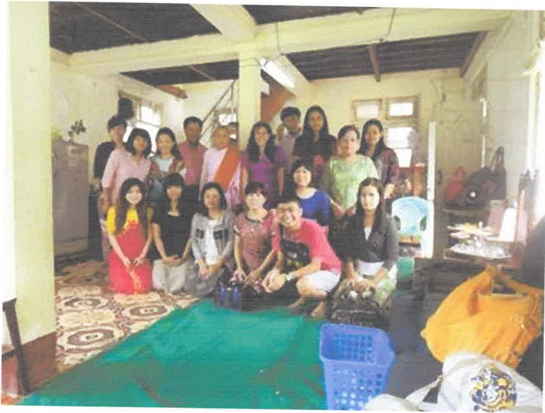
ရန်ကုန်မြို့၊ ရန်ကင်းမြို့နယ်၊ ပုဏ္ဏားတောရာမသီလရှင်စာသင်တိုက် ကွင်းဆင်းဆေးကုသမှုမှတ်တမ်း (၁.၉.၂၀၁၃)