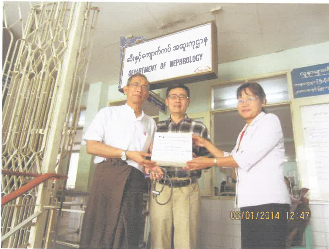
မန္တလေးဆေးရုံကြီးဆီးနှင့်ကျောက်ကပ်အထူးကုဌာနသို့ Haemo Dialysis အတွက်လှူဒါန်းစဉ် (၂.၁.၂၀၁၄)