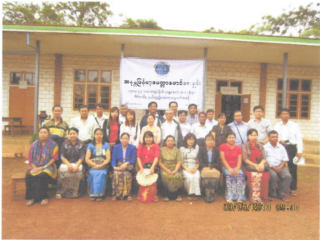
တောင်ကြီးမြို့အင်းလေးဒေသနွားမေတောင်ကျေးရွာ ကွင်းဆင်းဆေးကုသမှုမှတ်တမ်း (၉.၆.၂၀၁၃)