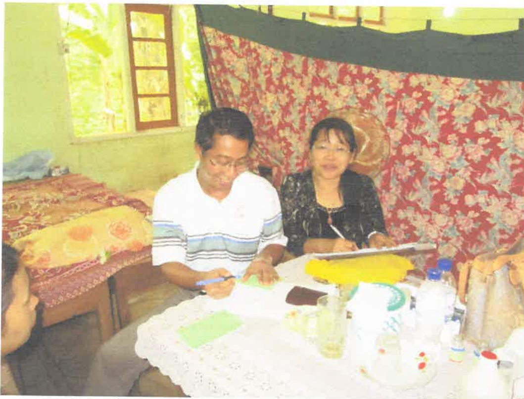
တောင်ကြီးမြို့အင်းလေးဒေသ၊ နွားဓမတောင်ကျေးရွာ ကွင်းဆင်းဆေးကုသမှုမှတ်တမ်း (၈.၆.၂၀၁၃)