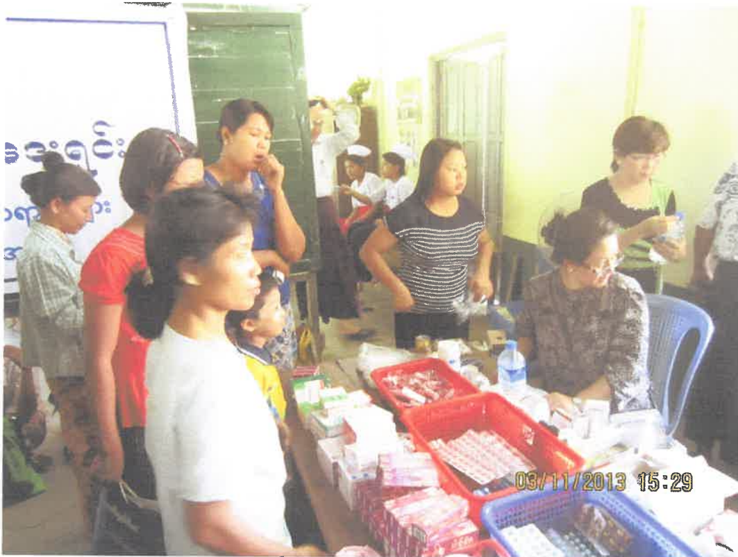
ရန်ကုန်မြို့၊ဟင်္သာတမြို့နယ်၊ဒွတ္တိကျေးရွာ ကွင်းဆင်းဆေးကုသမှုမှတ်တမ်း (၃.၁၁.၂၀၁၃)