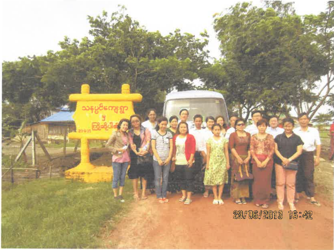
ရန်ကုန်မြို့၊သန်လျင်မြို့နယ်၊သနပ္ပင်ကျေးရွာ ကွင်းဆင်းဆေးကုသမှုမှတ်တမ်း (၂၉.၆.၂၀၁၃)