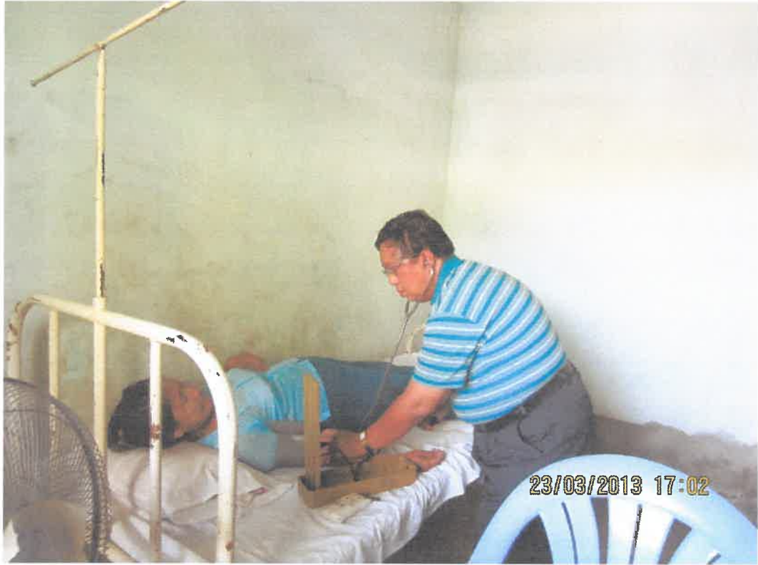
ဝါန်းဇွန်မြို့နယ်၊ဝါန်းမြာကြီးကျေးရွာ ကွင်းဆင်းဆေးကုသမှုမှတ်တမ်း (၂၃.၃.၂၀၁၃)