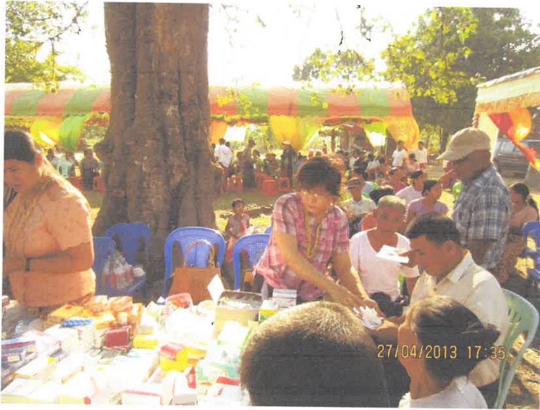
မွန်ပြည်နယ်ကျောက်မရောမြို့နယ်ကောသနောကျေးရွာ ကွင်းဆင်းဆေးကုသမှုမှတ်တမ်း (၂၇.၄.၂၀၁၃)