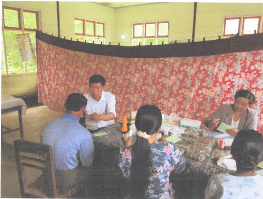
တောင်ကြီးမြို့၊အင်းလေးဒေသ၊နွားမေတောင်ကျေးရွာ ကွင်းဆင်းဆေးကုသမှုမှတ်တမ်း (၈.၆.၂၀၁၃)