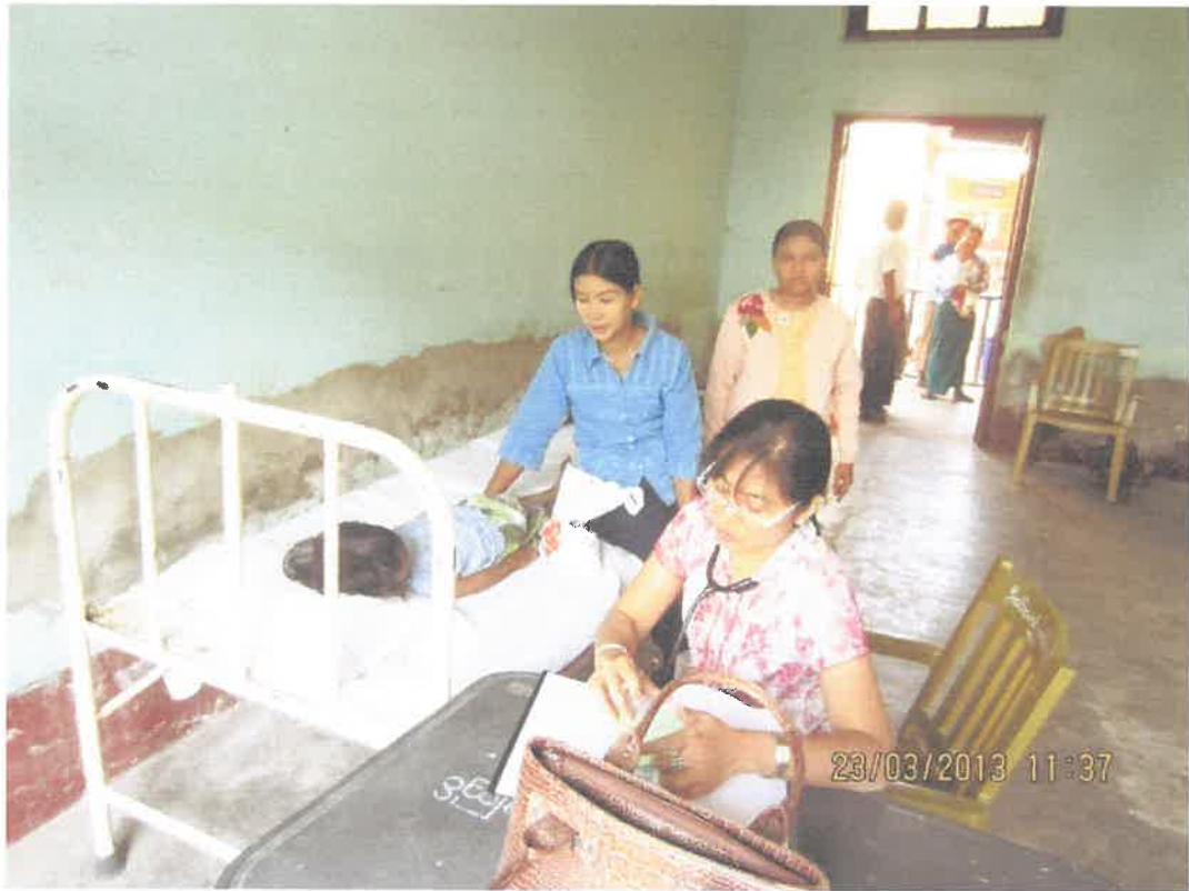
ဝါန်းဇွန်မြို့နယ်၊ဝါန်းမြာကြီးကျေးရွာ ကွင်းဆင်းဆေးကုသမှုမှတ်တမ်း (၂၃.၃.၂၀၁၃)