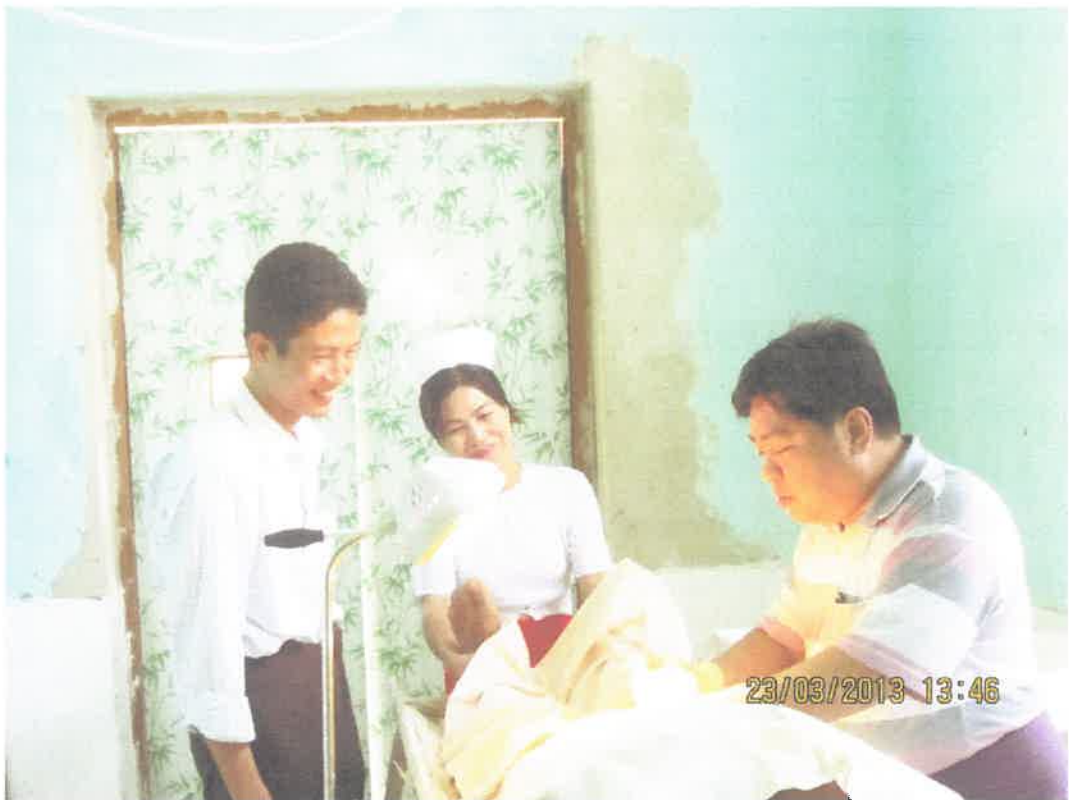
ဝါန်းဇွန်မြို့နယ်၊ဝါန်းမြာကြီးကျေးရွာ ကွင်းဆင်းဆေးကုသမှုမှတ်တမ်း (၂၃.၃.၂၀၁၃)