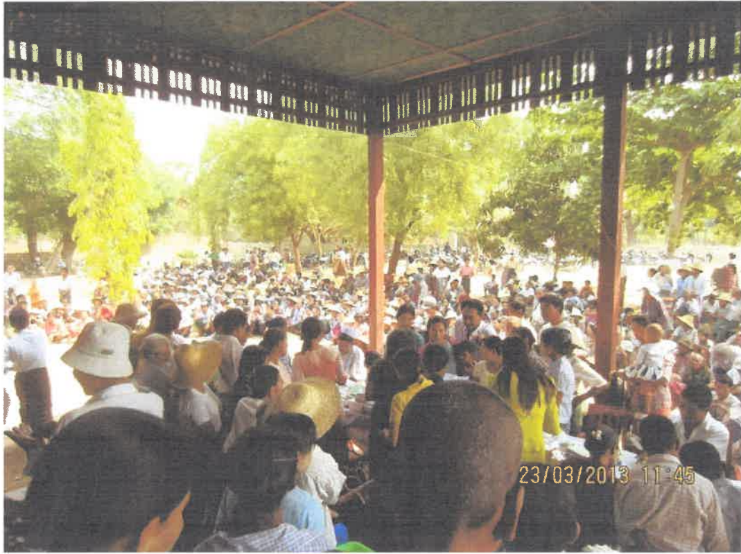
ဝါန်းဇွန်မြို့နယ်၊ဝါန်းမြာကြီးကျေးရွာ ကွင်းဆင်းဆေးကုသမှုမှတ်တမ်း (၂၃.၃.၂၀၁၃)