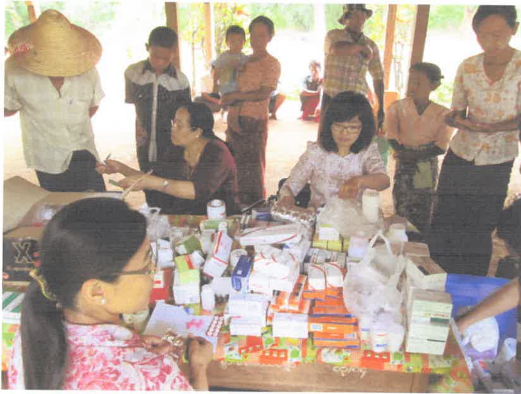
တောင်ကြီးမြို့၊အင်းလေးဒေသ၊နွားမေတောင်ကျေးရွာ ကွင်းဆင်းဆေးကုသမှုမှတ်တမ်း (၈.၆.၂၀၁၃)