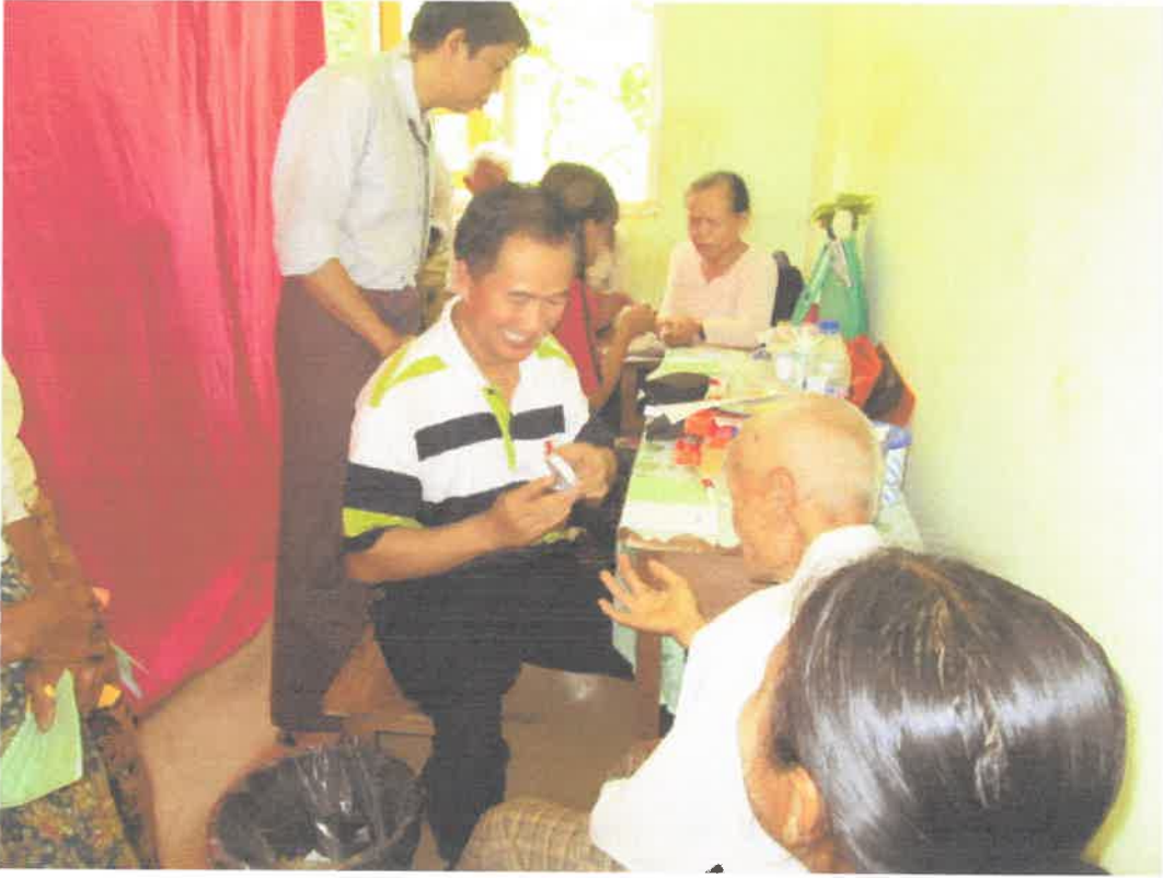
တောင်ကြီးမြို့၊အင်းလေးဒေသ၊နွားမေတောင်ကျေးရွာ ကွင်းဆင်းဆေးကုသမှုမှတ်တမ်း (၈.၆.၂၀၁၃)