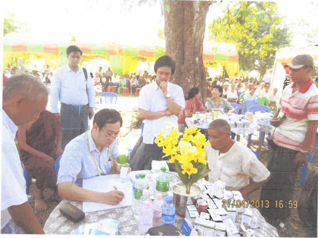
မွန်ပြည်နယ်ကျိုက်မရောမြို့နယ်ကောသနောကျေးရွာ ကွင်းဆင်းဆေးကုသမှုမှတ်တမ်း (၂၇.၄.၂၀၁၃)