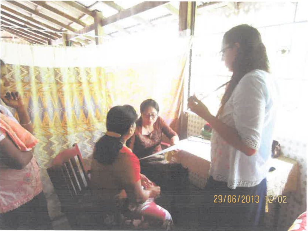
ရန်ကုန်မြို့၊သန်လျင်မြို့နယ်၊သနပ္ပင်ကျေးရွာ ကွင်းဆင်းဆေးကုသမှုမှတ်တမ်း (၂၉.၆.၂၀၁၃)