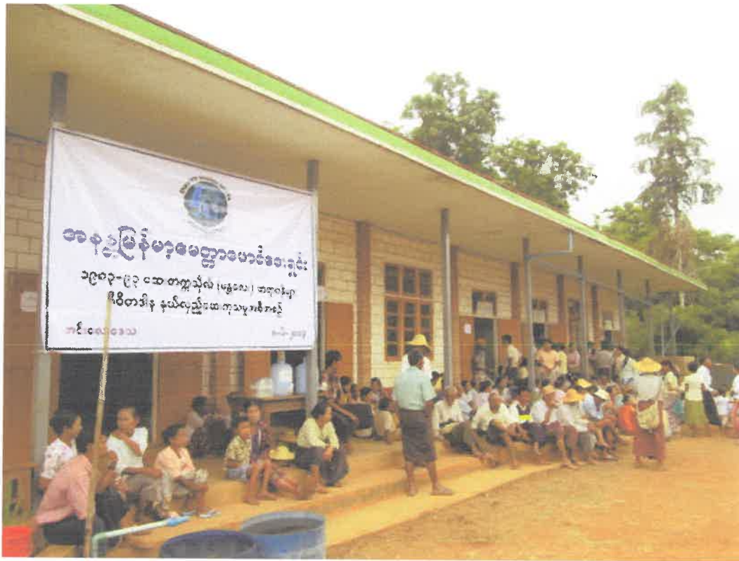
တောင်ကြီးမြို့၊ အင်းလေးဒေသ၊ နွားမေတောင်ကျေးရွာ ကွင်းဆင်းဆေးကုသမှုမှတ်တမ်း (၈.၆.၂၀၁၃)