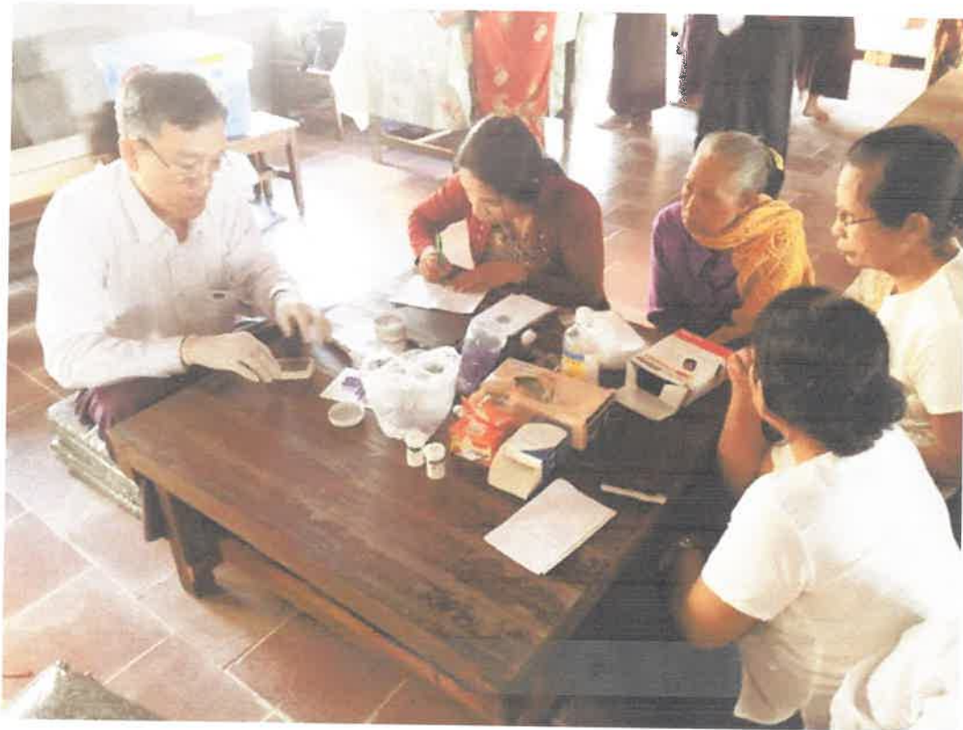
ရန်ကုန်မြို့၊ သန်လျင်မြို့နယ်၊ သဘာဝတရားရိပ်သာ ကွင်းဆင်းဆေးကုသမှုမှတ်တမ်း (၈.၁၂.၂၀၁၃)