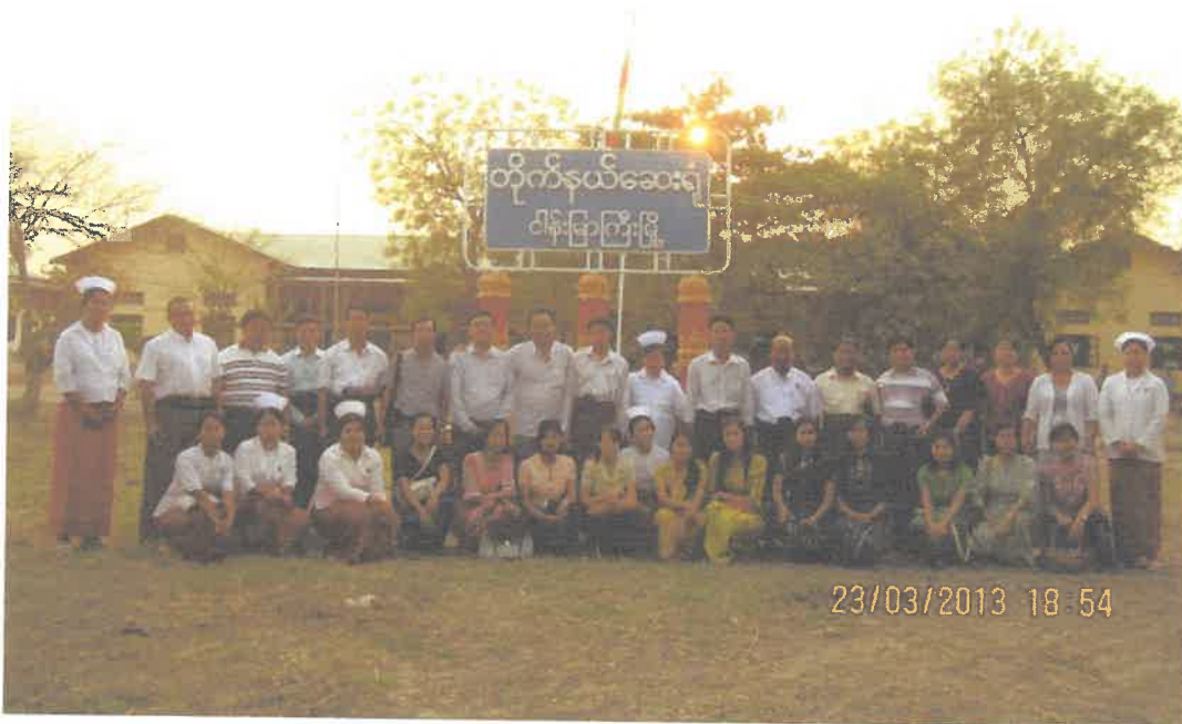
ဝါန်းစွန်မြို့နယ်၊ ဝါန်းမြာကြီးကျေးရွာ ကွင်းဆင်းဆေးကုသမှုမှတ်တမ်း (၂၃.၃.၂၀၁၃)