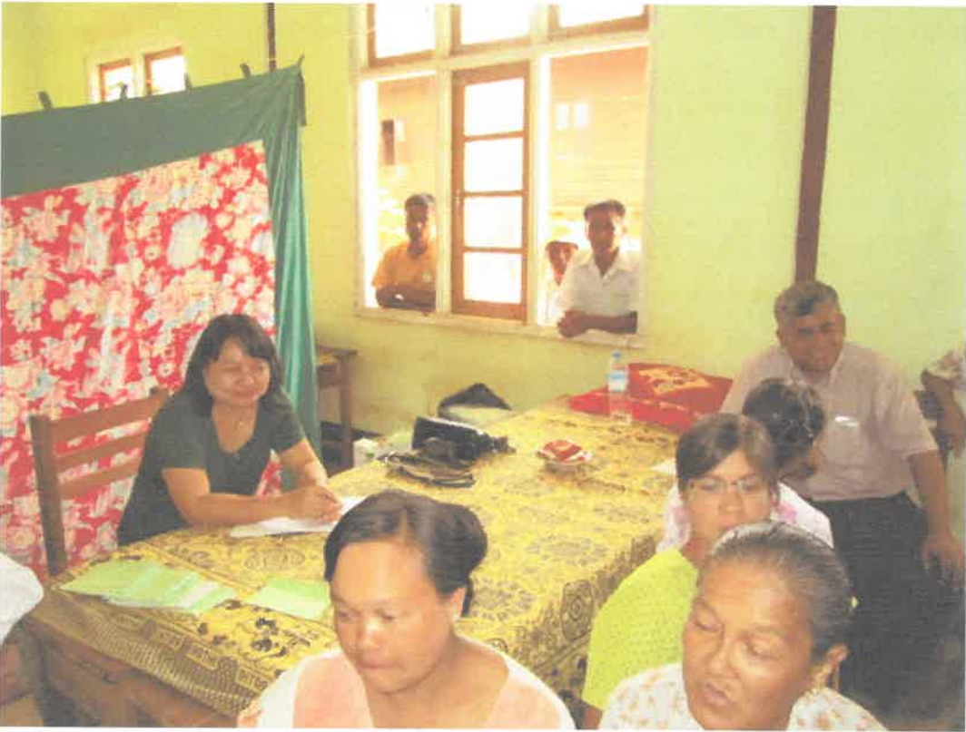
တောင်ကြီးမြို့၊အင်းလေးဒေသ၊နွားမေတောင်ကျေးရွာ ကွင်းဆင်းဆေးကုသမှုမှတ်တမ်း (၈.၆.၂၀၁၃)