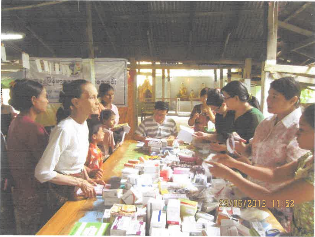
ရန်ကုန်မြို့၊ သန်လျင်မြို့နယ်၊ သနပွင်ကျေးရွာ ကွင်းဆင်းဆေးကုသမှုမှတ်တမ်း (၂၉.၆.၂၀၁၃)