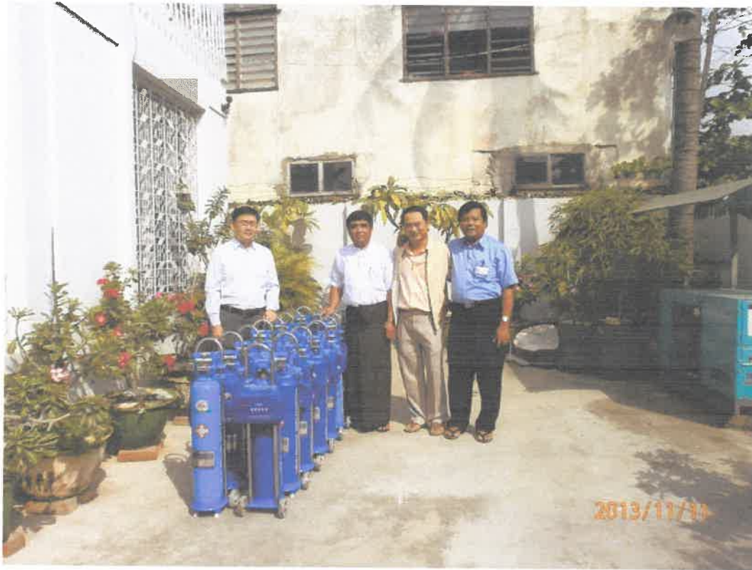
မန္တလေးဆေးရုံကြီးသို့ Oxygen Cylinders (၂၀)လုံး လှူဒါန်းမှု မှတ်တမ်း (၁၁.၁၁.၂၀၁၃)