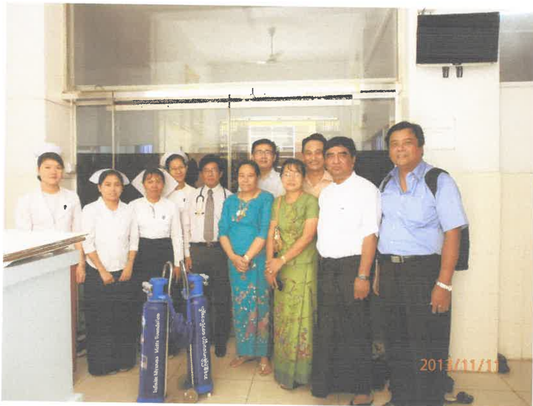
မန္တလေးဆေးရုံကြီး နှလုံးအထူးကုဆောင်သို့ Oxygen Cylinders လှူဒါန်းစဉ် (၁၁.၁၁.၂၀၁၃)