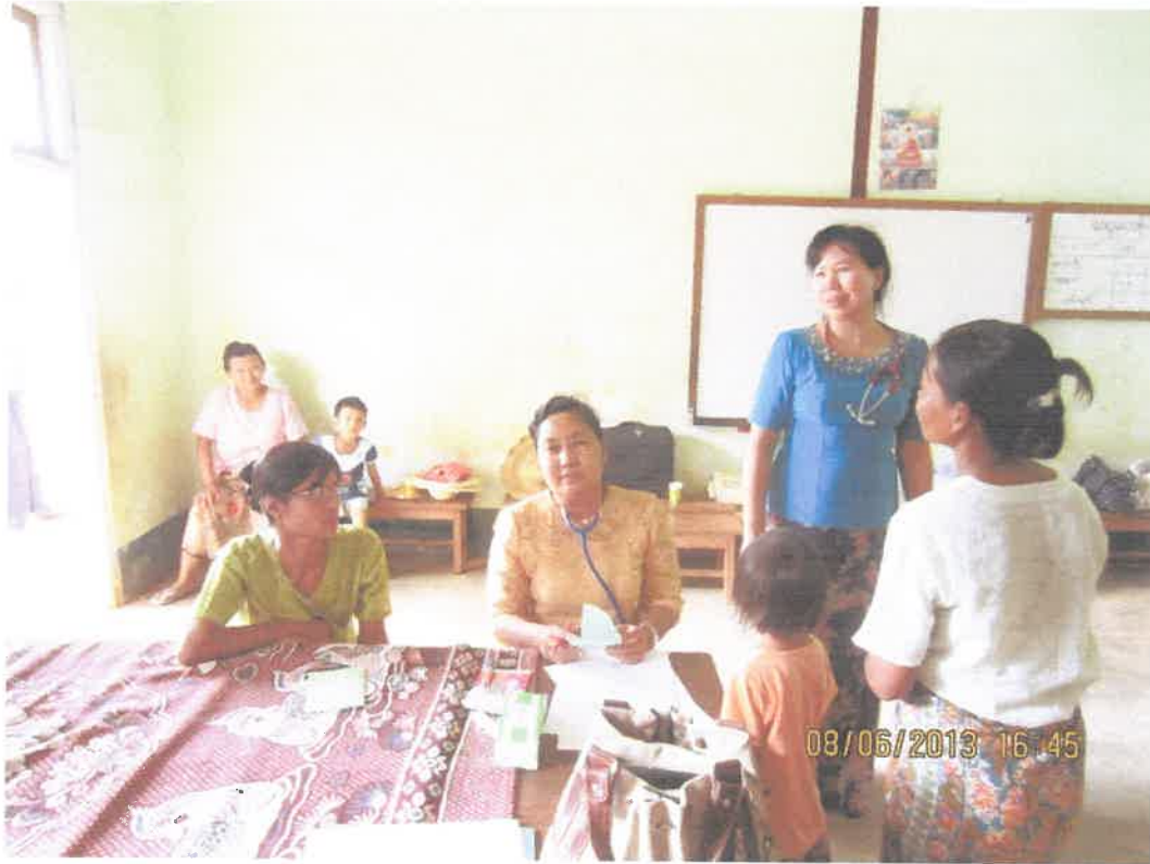
တောင်ကြီးမြို့၊အင်းလေးဒေသ၊နွားမေတောင်ကျေးရွာ ကွင်းဆင်းဆေးကုသမှုမှတ်တမ်း (၈.၆.၂၀၁၃)