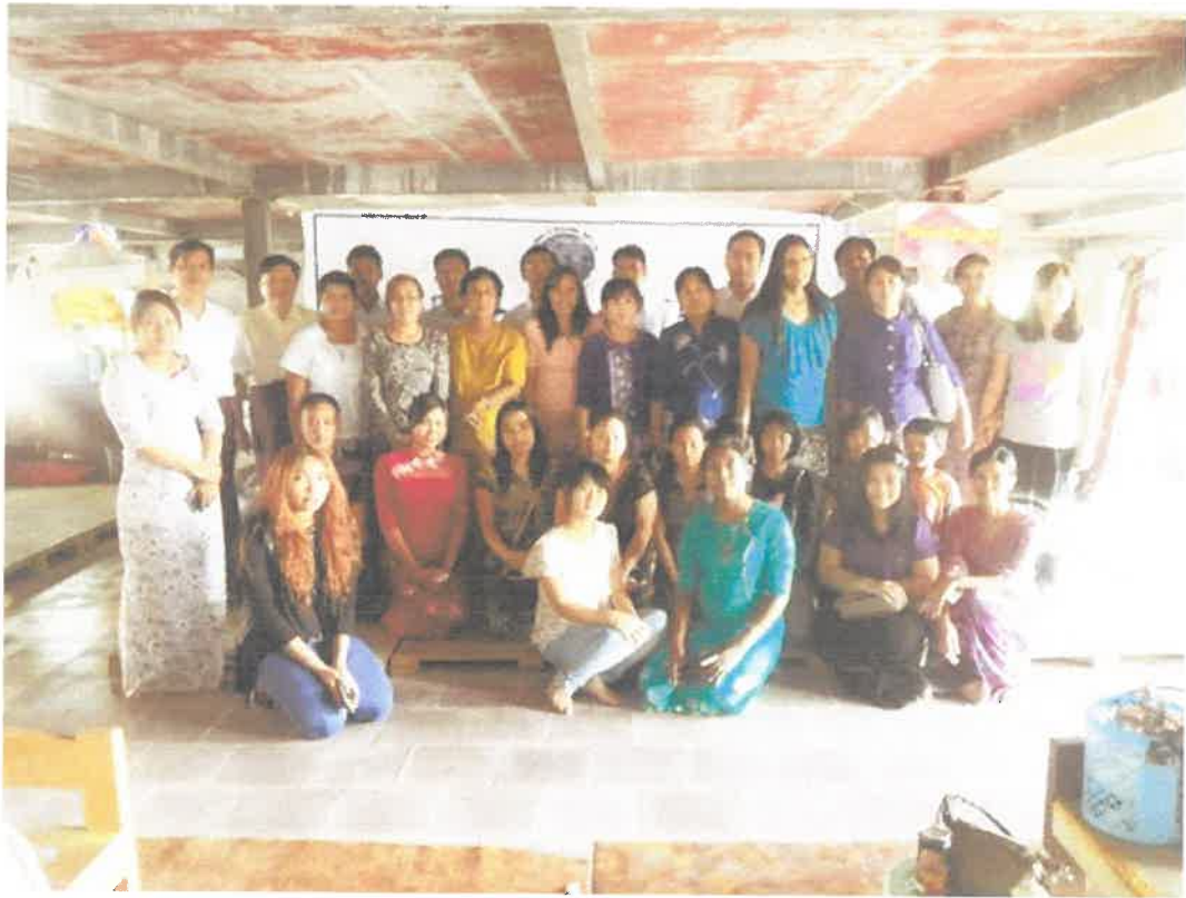
ရန်ကုန်မြို့၊ သန်လျင်မြို့နယ်၊ သဘာဝတရားရိပ်သာ ကွင်းဆင်းဆေးကုသမှုမှတ်တမ်း (၈.၁၂.၂၀၁၃)