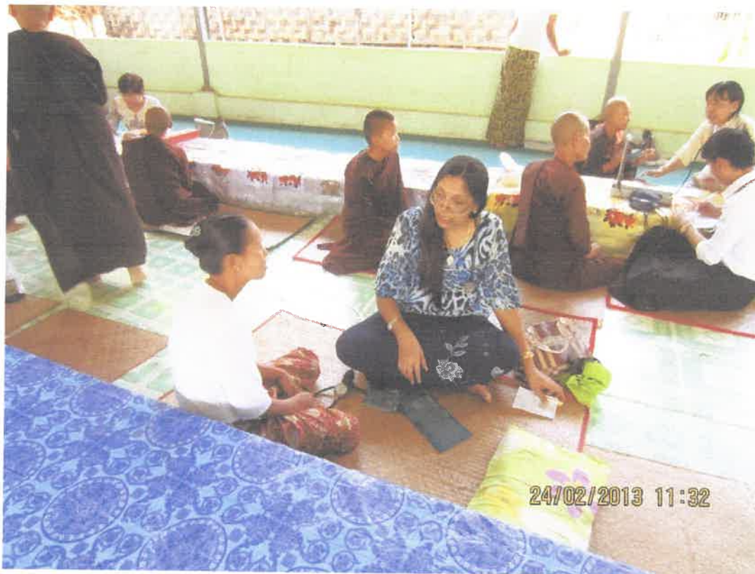
ရန်ကုန်မြို့၊ တိုက်ကြီးမြို့နယ်၊ လိမ္မော်စုကျေးရွာ၊ မြစ်မီးတောင်တောရရိပ်သာ ကွင်းဆင်းဆေးကုသမှုမှတ်တမ်း (၂၄.၂.၂၀၁၃)