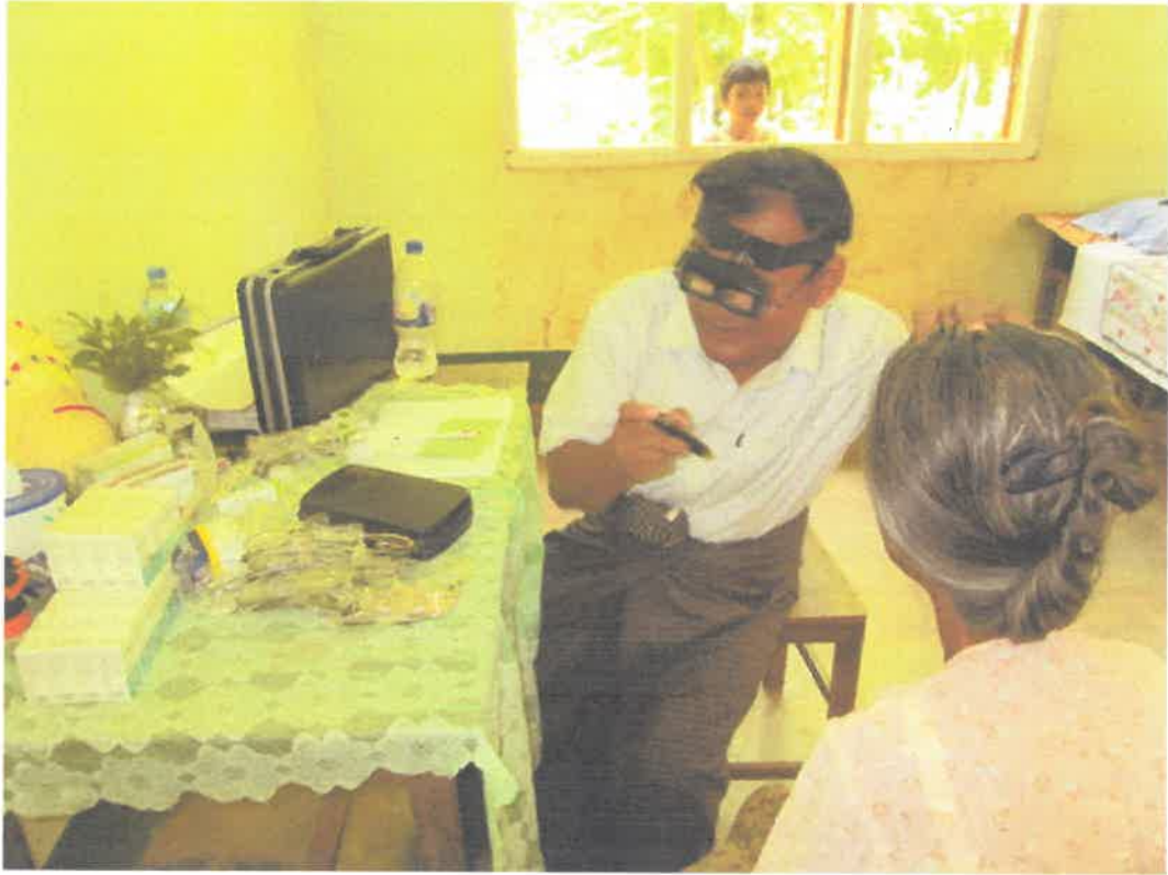
တောင်ကြီးမြို့၊အင်းလေးဒေသ၊နွားမေတောင်ကျေးရွာ ကွင်းဆင်းဆေးကုသမှုမှတ်တမ်း (၈.၆.၂၀၁၃)