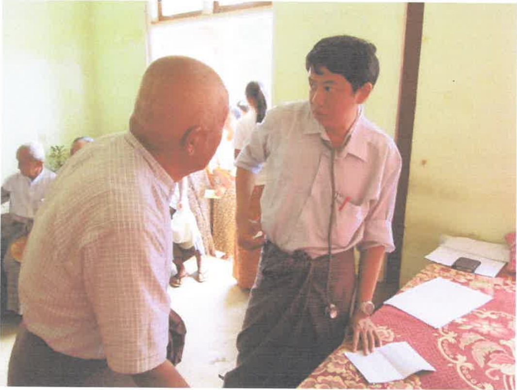
တောင်ကြီးမြို့၊အင်းလေးဒေသ၊နွားမေတောင်ကျေးရွာ ကွင်းဆင်းဆေးကုသမှုမှတ်တမ်း (၈.၆.၂၀၁၃)