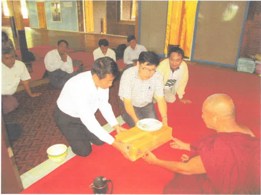
တောင်ကြီးမြို့အင်းလေးဒေသနွားမေတောင်ကျေးရွာ ဘုန်းတော်ကြီးအား နဂကမ္မဝတ္ထုငွေကပ်လှူခြင်း (၉.၆.၂၀၁၃)