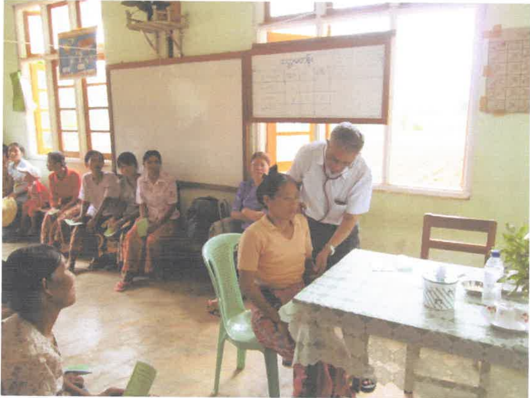
တောင်ကြီးမြို့၊အင်းလေးဒေသ၊နွားမေတောင်ကျေးရွာ ကွင်းဆင်းဆေးကုသမှုမှတ်တမ်း (၈.၆.၂၀၁၃)