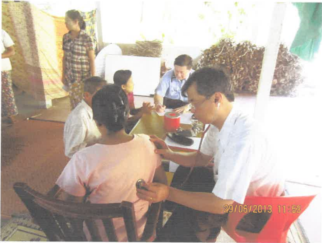
ရန်ကုန်မြို့၊ သန်လျင်မြို့နယ်၊ သနပွင်ကျေးရွာ ကွင်းဆင်းဆေးကုသမှုမှတ်တမ်း (၂၉.၆.၂၀၁၃)