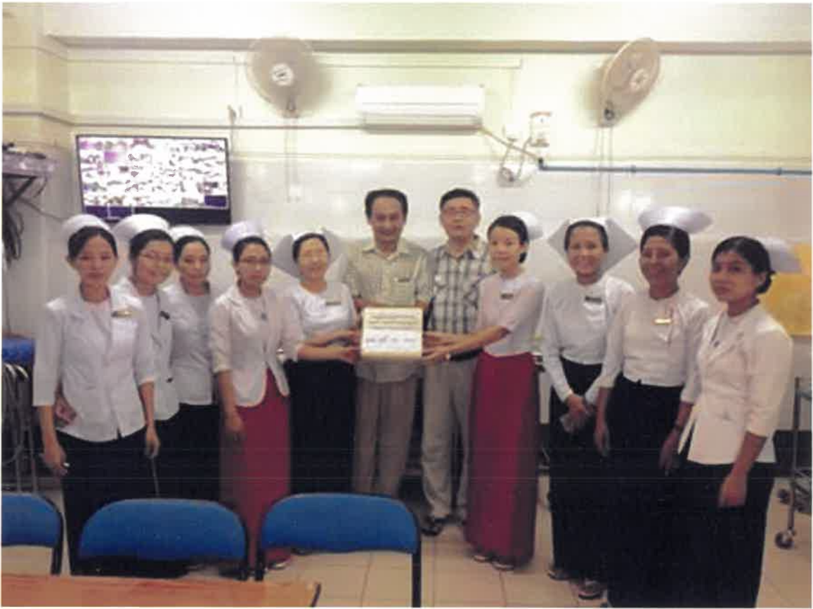
5.6.2015 Renal Dialysis Case အတွက် မန္တလေးပြည်သူ့ဆေးရုံကြီး တွင်လှူဒါန်းမှုမှတ်တမ်း