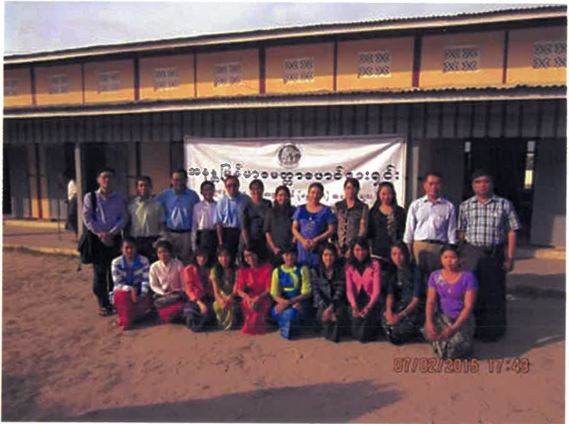
7.2.2015 လက်ပံကျင်းကျေးရွာ ကွင်းဆင်းဆေးကုမှတ်တမ်း