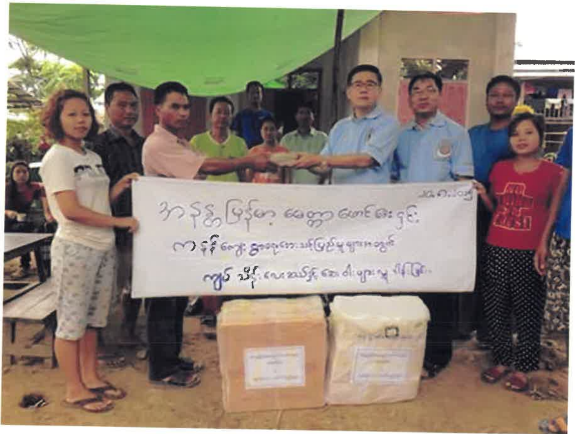
20.8.2015 ကလေးကြို့နယ် ကနပ်ကျေးရွာ ကွင်းဆင်းဆေးကုသမှုနှင့်ရေသောက်ရေးအလှူ မှတ်တမ်း