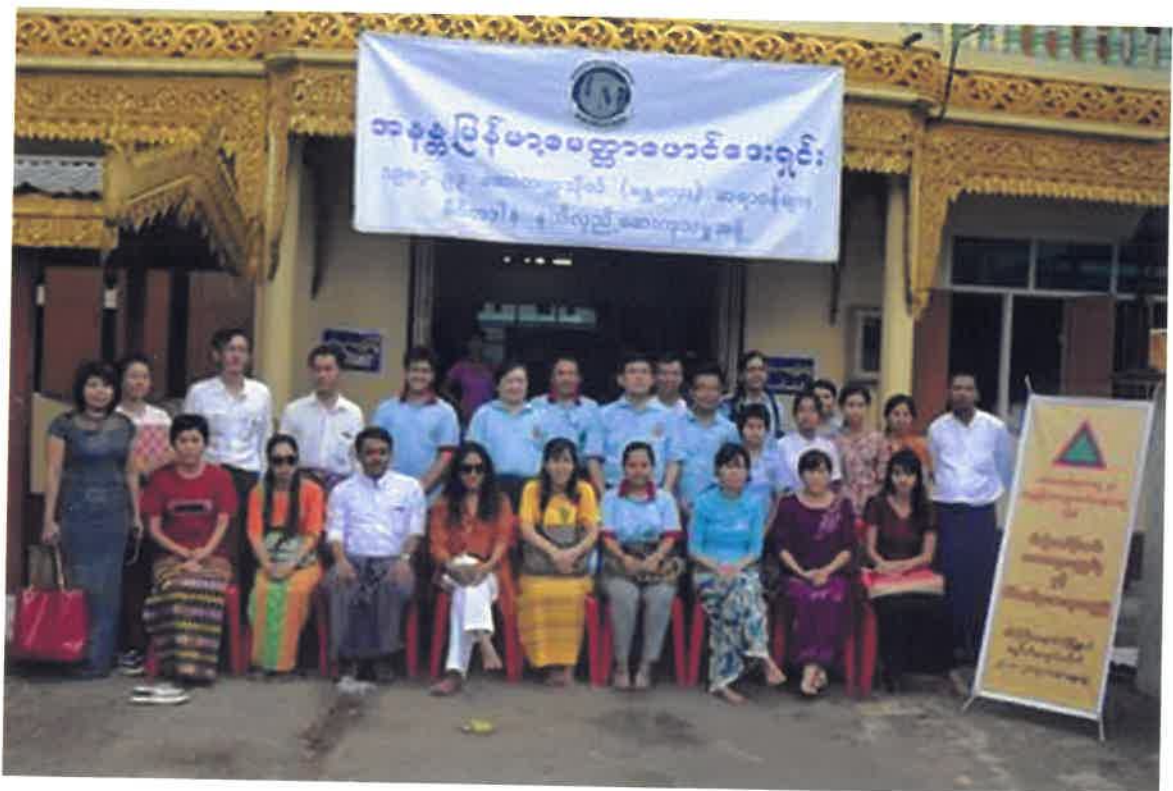
23.8.2015 ဆိပ်ကြီးခနောင်တိုကြို့ ကွင်းဆင်းဆေးကုမှတ်တမ်း