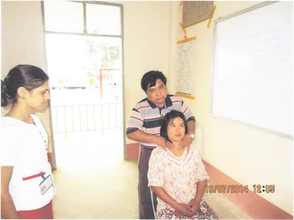
1.8.2014 ဒေါက်တာလှဘုန်းပြင်ဦးလွင်မြို့နယ်၊ မိုးကြိုးရွာ ကွင်းဆင်းဆေးကုသမှုစဉ်