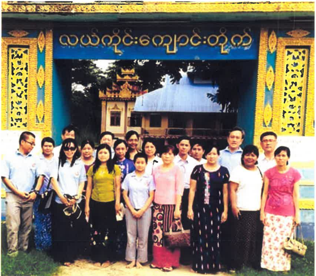
31.5.2015 မအူပင်မြို့နယ် လယ်ကိုင်းကျေးရွာ ကွင်းဆင်းဆေးကုမှတ်တမ်း