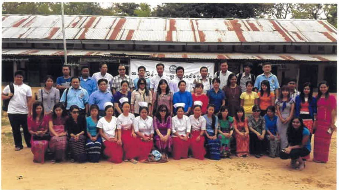
28.6.2015 မကွေးတိုင်း ကန်ဦးကျေးရွာ ကွင်းဆင်းဆေးကုမှတ်တမ်း