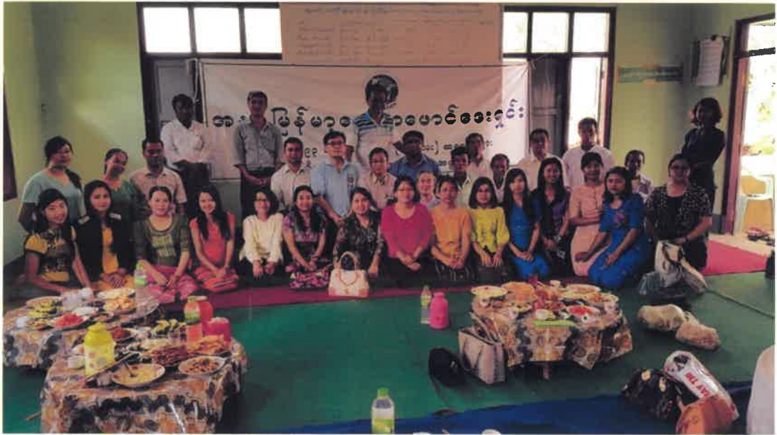
26.4.2015 နွားတိုးကြီးမြို့နယ် လက်ပံကျေးရွာ ကွင်းဆင်းဆေးကုမှတ်တမ်း