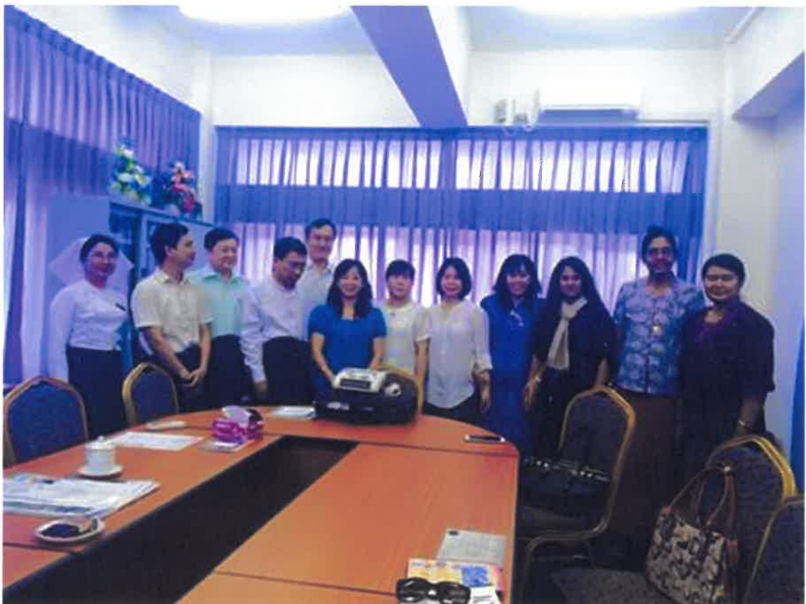
22.6.2015 သူနာပြုဆရာမများပညာသင်ထောက်ပံ့မှုနှင့် အဆုတ်အားတိုင်းစက်လှူဒါန်းမှုမှတ်တမ်း