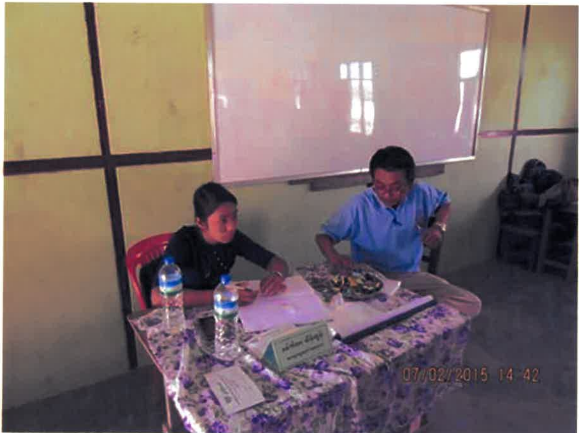
7.2.2015 ဒေါက်တာမောင်မောင်သွင်လက်ပံကျင်းကျေးရွာကွင်းဆင်းဆေးကုသစဉ်