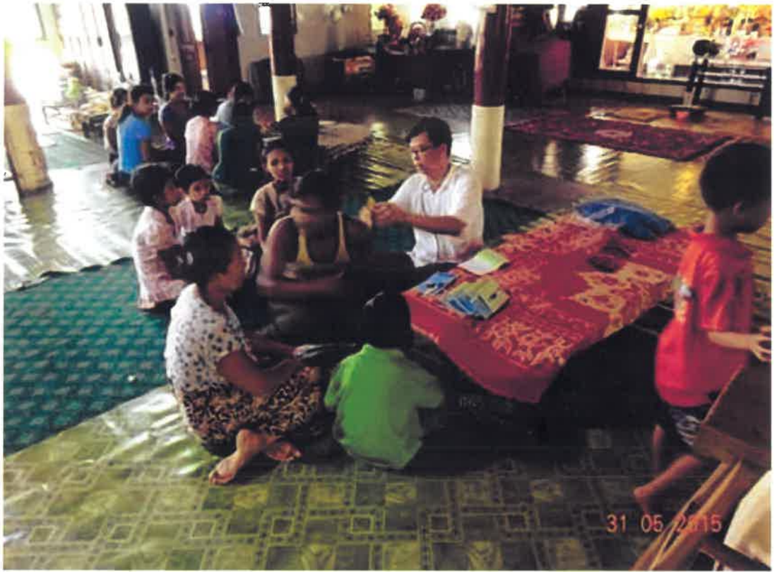
31.5.2015 မအူပင်မြို့နယ် လယ်ကိုင်းကျေးရွာ ကွင်းဆင်းဆေးကုမှတ်တမ်း