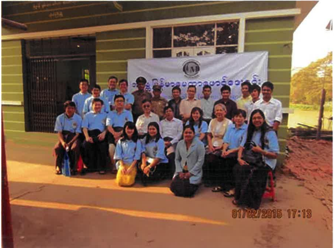
1.2.2015 တိုက်ကြီးမြို့နယ် ကွင်းဆင်းဆေးကုမှတ်တမ်း