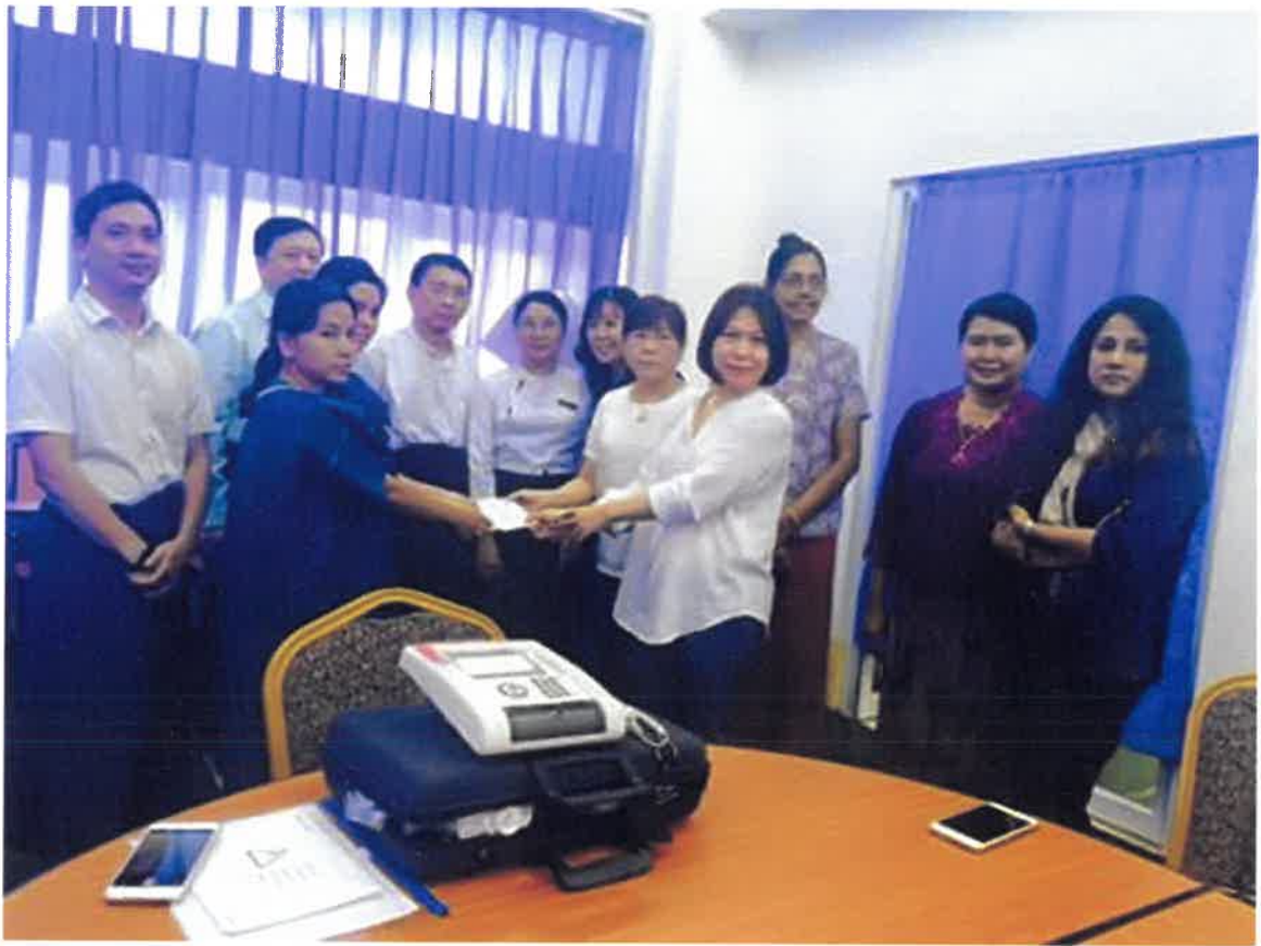
22.6.2015 သူနာပြုဆရာမများပညာသင်ထောက်ပံ့မှုနှင့် အဆုတ်အားတိုင်းစက်လှူဒါန်းမှုမှတ်တမ်း